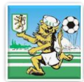
Lauréat 2017 : Les Landes Genusson

Le 2nd et le 3ème remporteront « Un kit matériel »