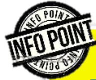
Table ronde :