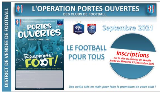
Le livret pédagogique

(Guide, conseils, idées pour la mise en place de l'animation à destination du chef de projet du club)