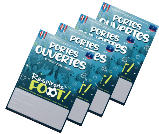
Les flyers (Ecoles, postage, de la main à la main)