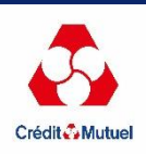
PHOTO DE L'ACTION