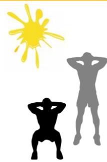
N°5 : Squats 1 minute 30