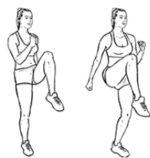
N°2 : Montée de genoux 1 minute 30