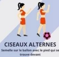
CISEAUX ALTERNES Semelle sur le ballon avec le pied qui se trouve devant

PRENDS TON TAPIS, TON BALLON, TA BOUTEILLE D'EAU ET FAIS CES EXOS :