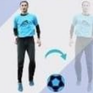
SKIPPING Réalise 3 pas de chaque côté du ballon. Passe au dessus pour le changement de côté