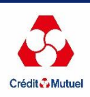
PHOTO DE L'ACTION